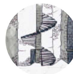
Le Puits à Muyre