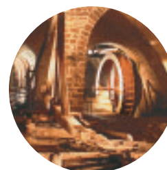
Le Puits d'Amont

Ce sondage du XIX e siècle, à 246 m de profondeur, dont la pompe fonctionne encore aux Salines avec le mécanisme d'époque, fournit les "eaux vierges" chargées à saturation (330 g de sel par litre). Celles-ci sont utilisées dans le cadre de soins spécifiques.