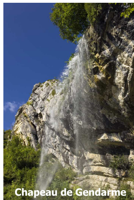
Chapeau de Gendarme

Pour cette 2ème édition, c'est le Parc Naturel Régional du Haut-Jura qui est à l'honneur. Grâce aux 3 randonnées sélectionnées aux alentours de Lajoux, siège de la maison du Parc, vous découvrirez les paysages typiques du massif du Jura et des sites réputés.